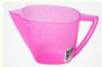
2. Gelas Ukur