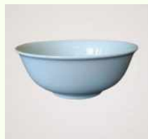
6. Mangkok Plastik