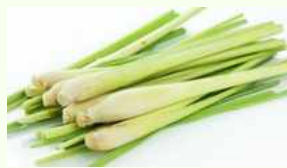
9. Serai 200gr