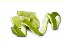
8. Kulit Jeruk Nipis 200gr